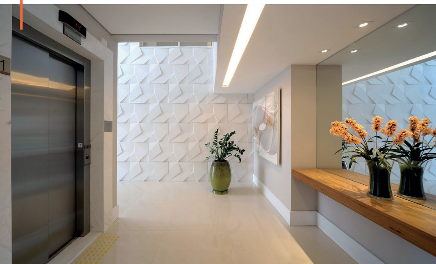
Lobby / Lobby

Nome/name: Park View Perdizes Localização/address: Rua Itapicuru, 801 Perdizes | São Paulo (SP) Categoria/type: Residencial/residential Produto/product: 3 suítes – 128 m 2 / 3 suítes – 128 sqm Torre única/Single tower Unidades/units: 32 Área construída/built area: 7.026 m 2 / 7,026 sqm Construção/construction: THINK Construtora Incorporação Real Estate Development: THINK Construtora Ano/year: Outubro/2016 October/2016