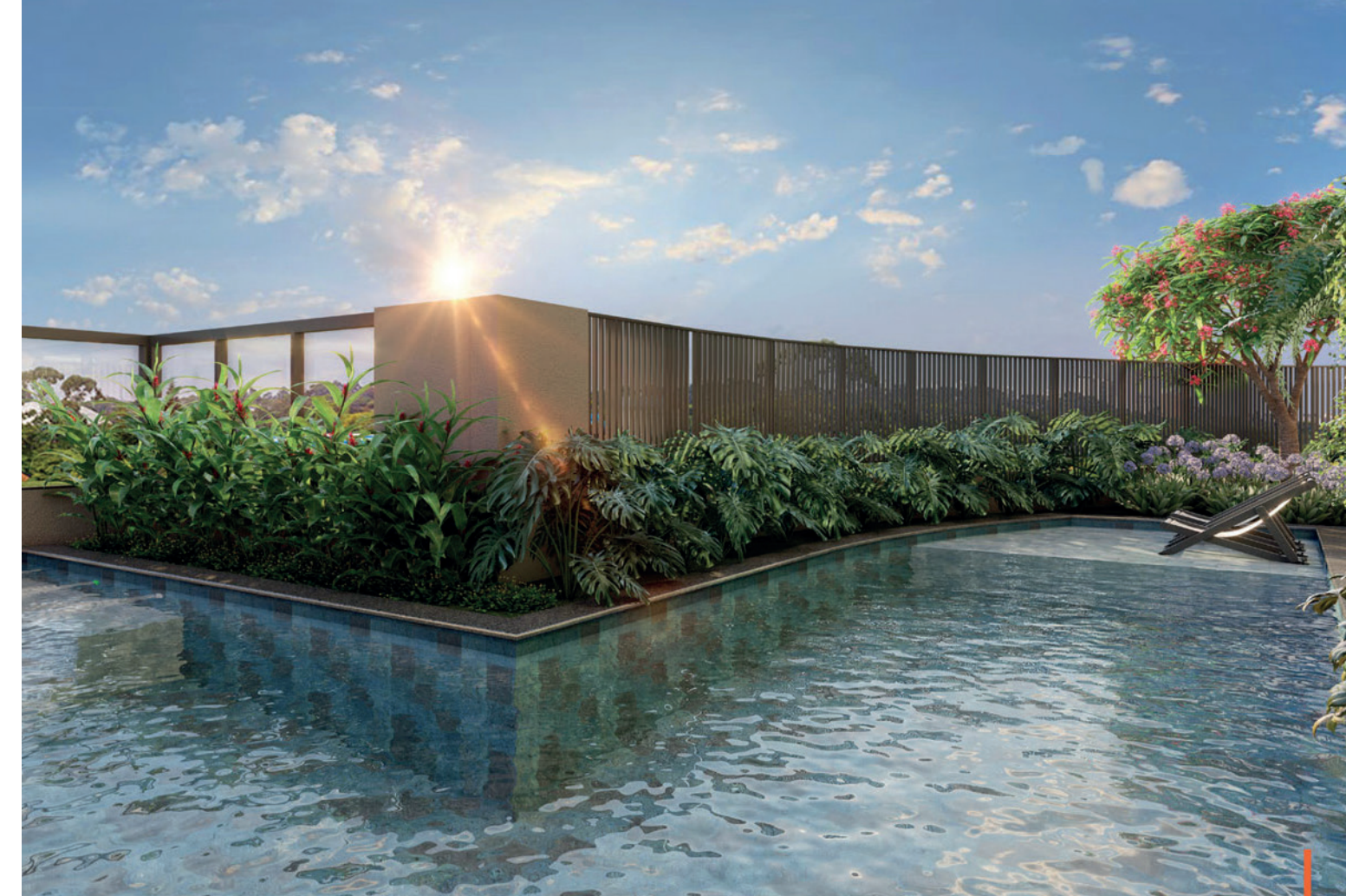
Perspectiva artística da piscina / Artist's impression of the swimming pool