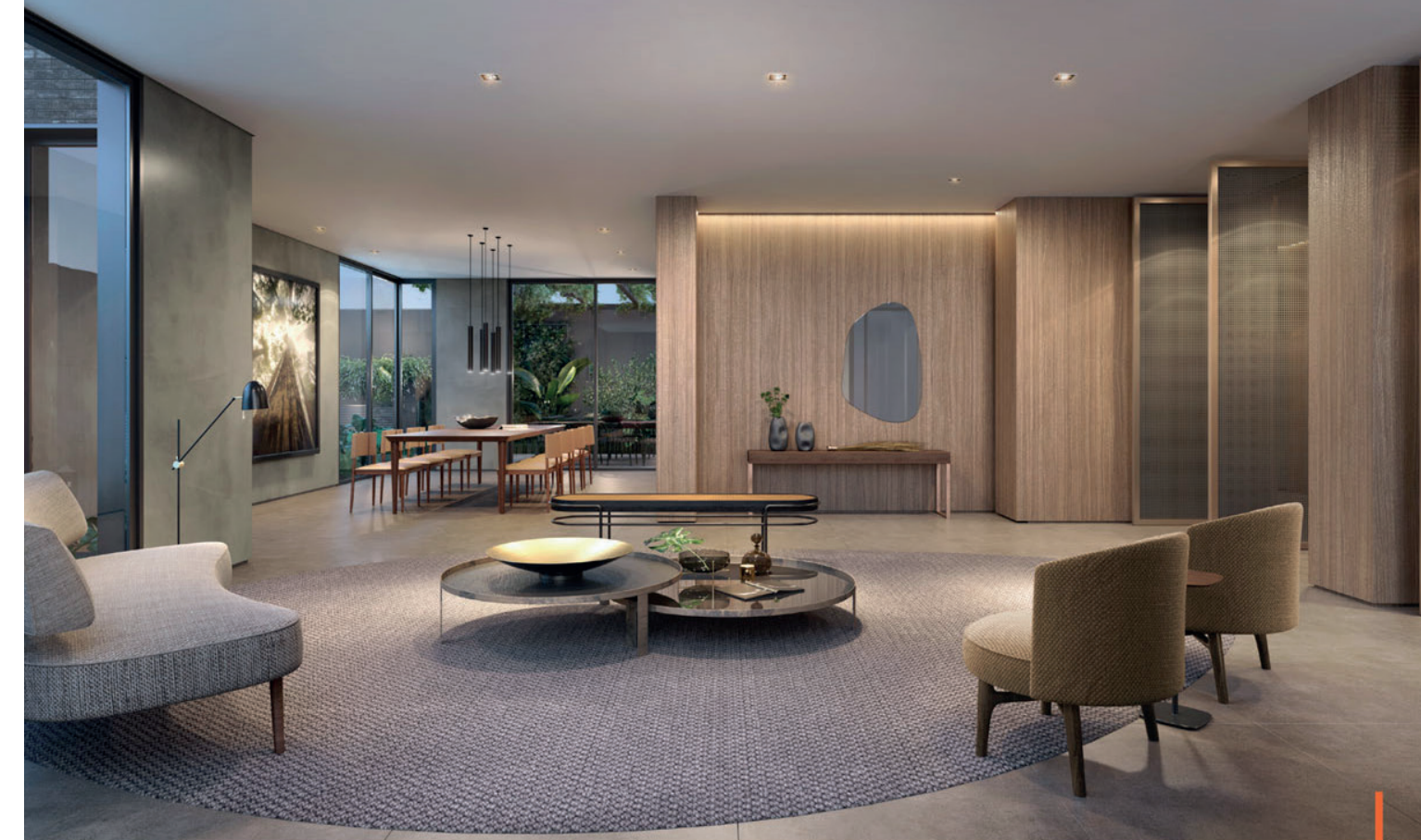
Perspectiva artística do salão de festas / Artist's impression of the function room