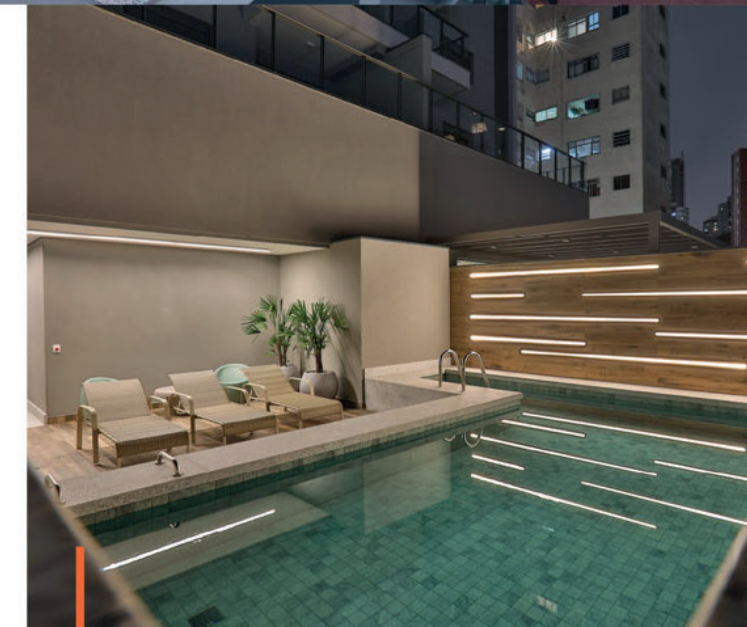
Piscina/ Swimming pool

N a THINK, somos cuidadosos com cada etapa do projeto e buscamos o bem-estar de todos que de alguma forma se conectam com nossas obras. Uma das primeiras atitudes antes de iniciarmos a construção é o nosso relacionamento com os vizinhos. Encaminhamos-lhes um informativo com os horários e prazos das obras, no intuito de manter um canal aberto de comunicação para reforçar o compromisso da THINK em minimizar possíveis impactos na rotina da região. Uma ação que faz parte do compromisso da empresa com a comunidade.