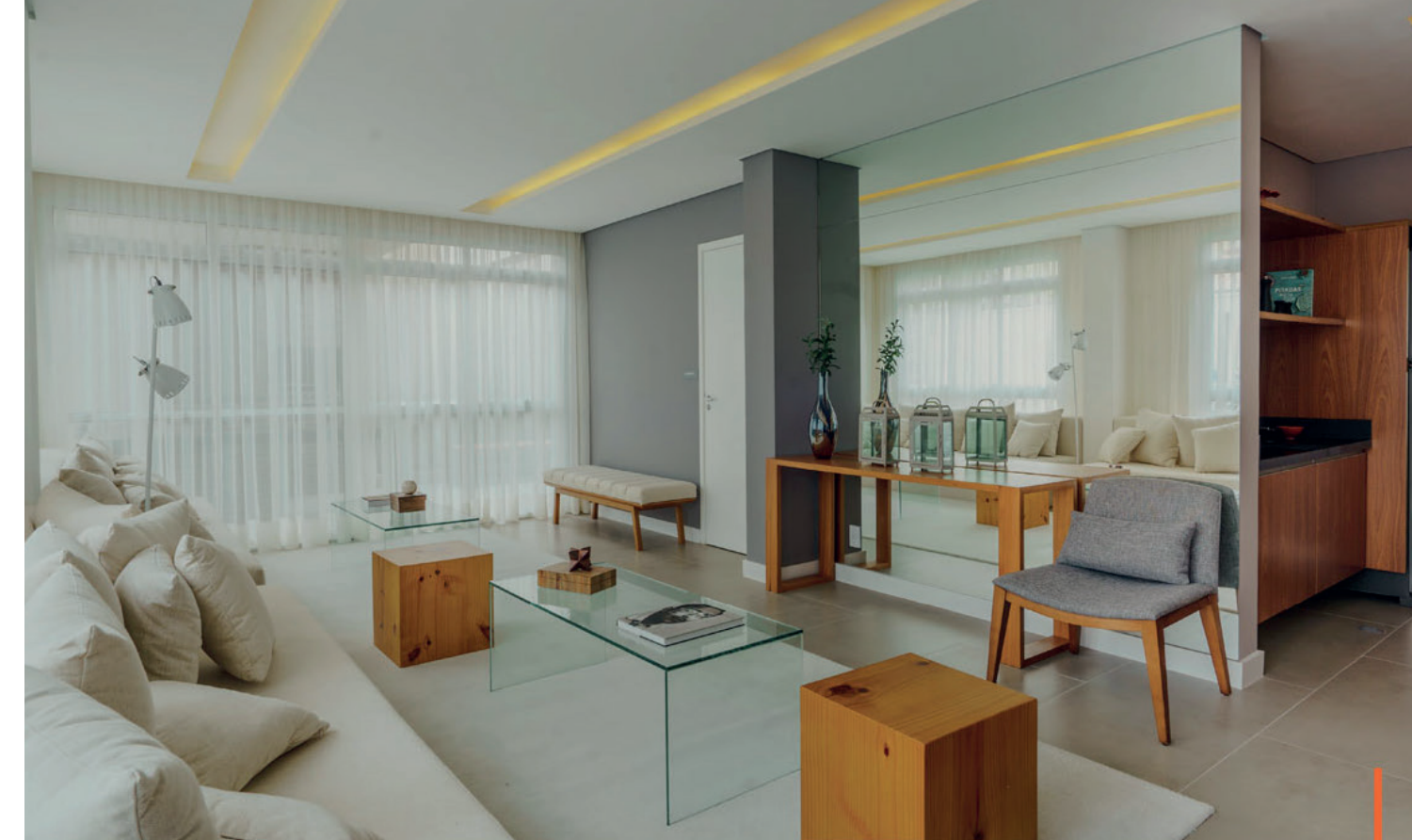
Salão de festas / Party hall

“Empreendimento premium exclusivo para o bairro.” “An exclusive premium development for the district.”