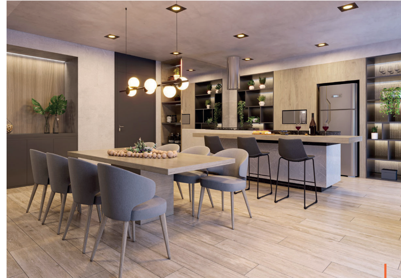
Perspectiva artística do espaço gourmet / Artist's impression of the fine dining area