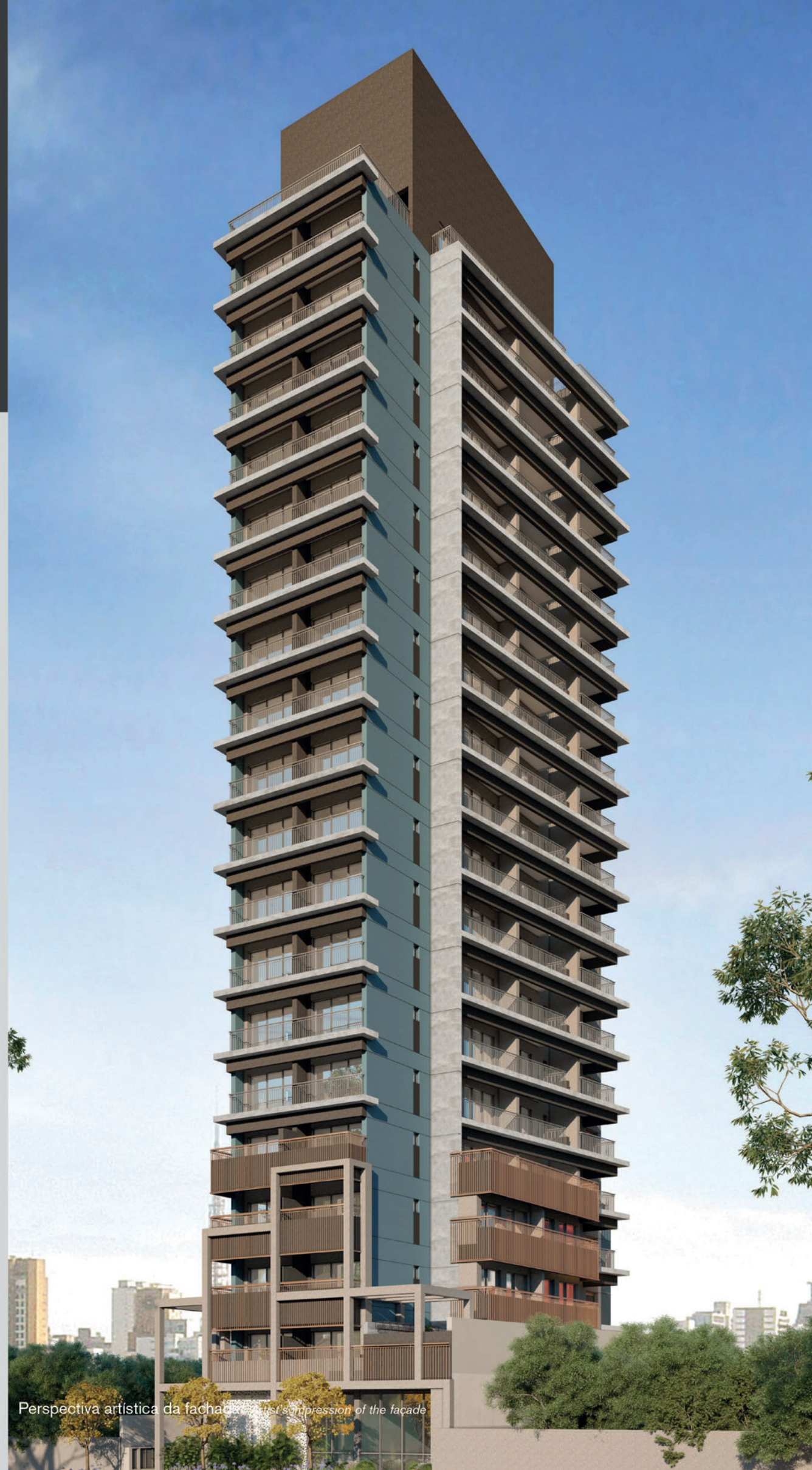
Perspectiva artística da fachada / Artist's impression of the facade

“Um empreendimento aberto para as ideias.”