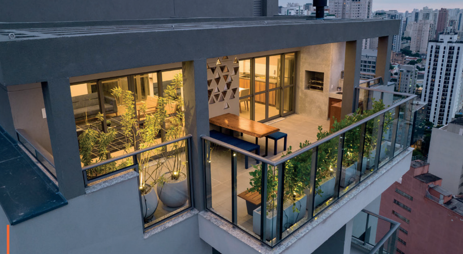
Salão de festas/ Party hall

“Everyone’s well-being in contact with our buildings.”