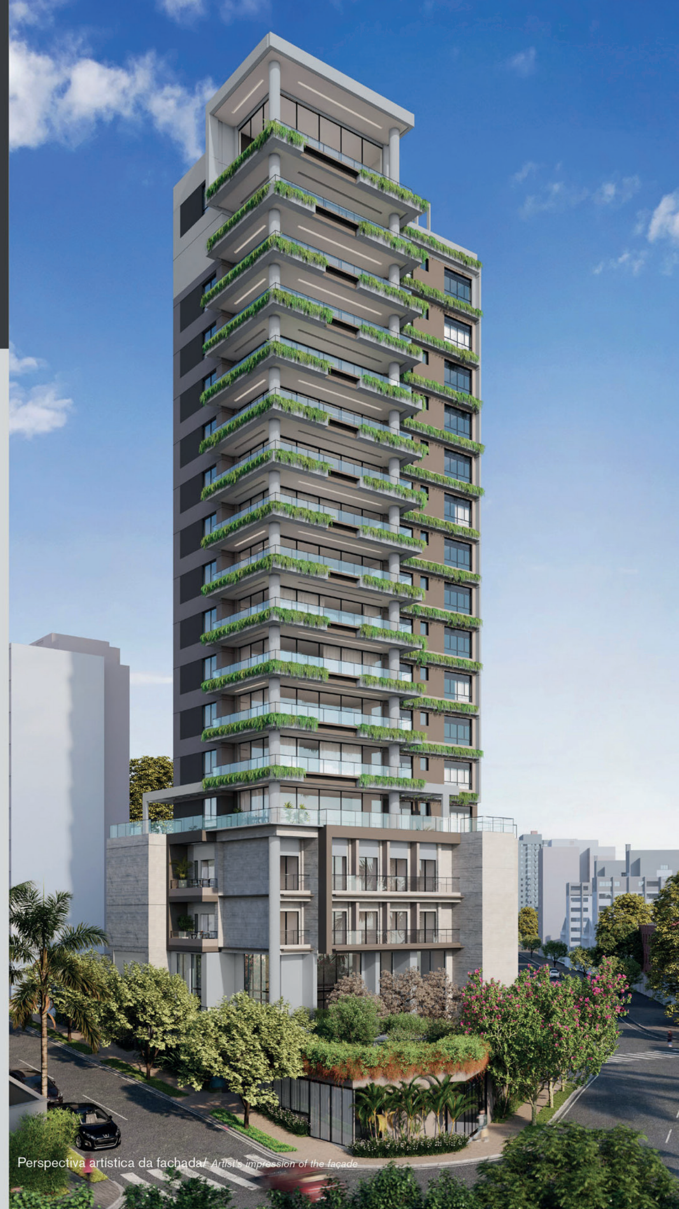
Perspectiva artística da fachada / Artist's impression of the facade

“Sinônimo de exclusividade em cada detalhe por m 2 .”