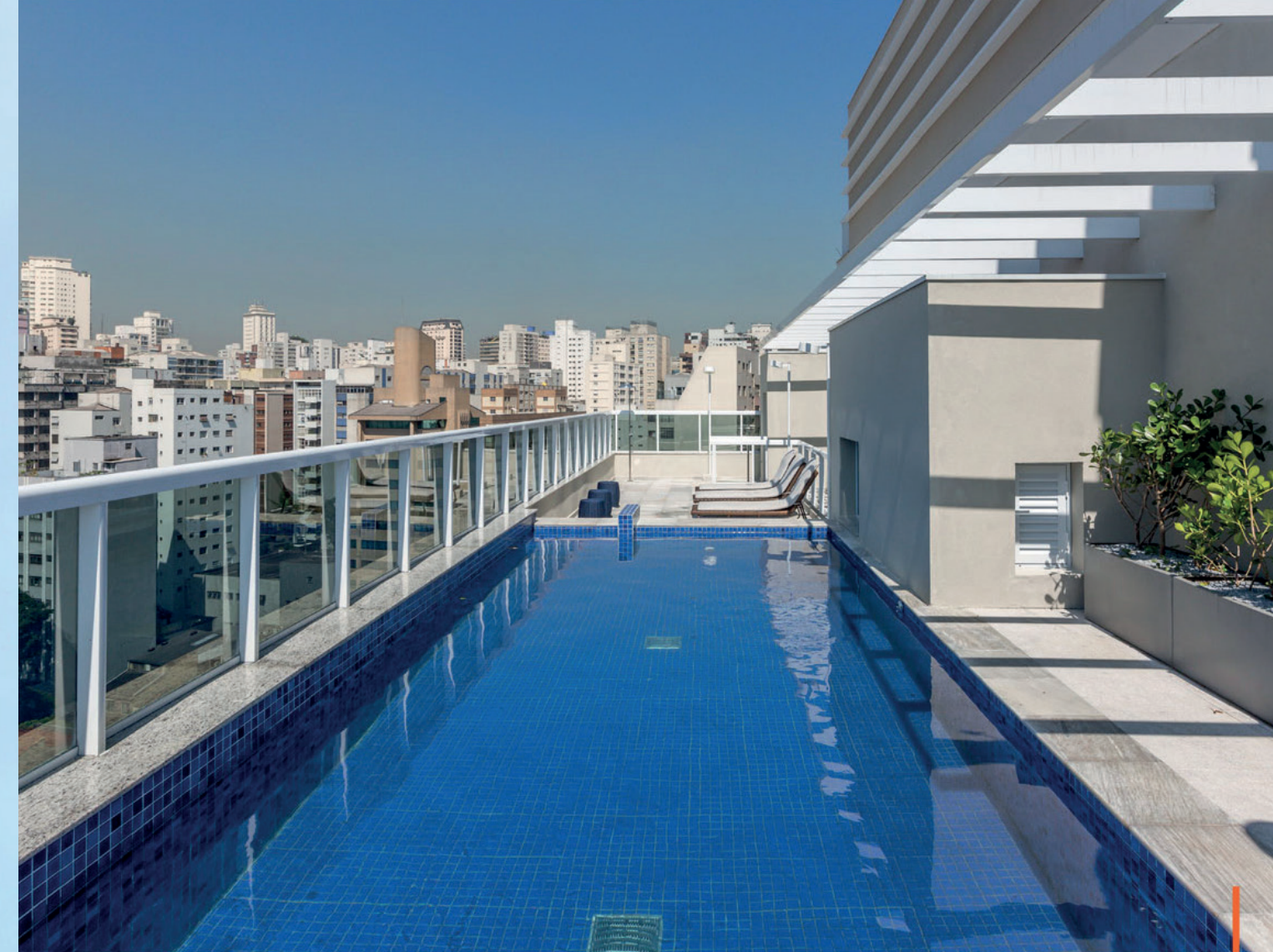
Piscina na cobertura / Rooftop pool