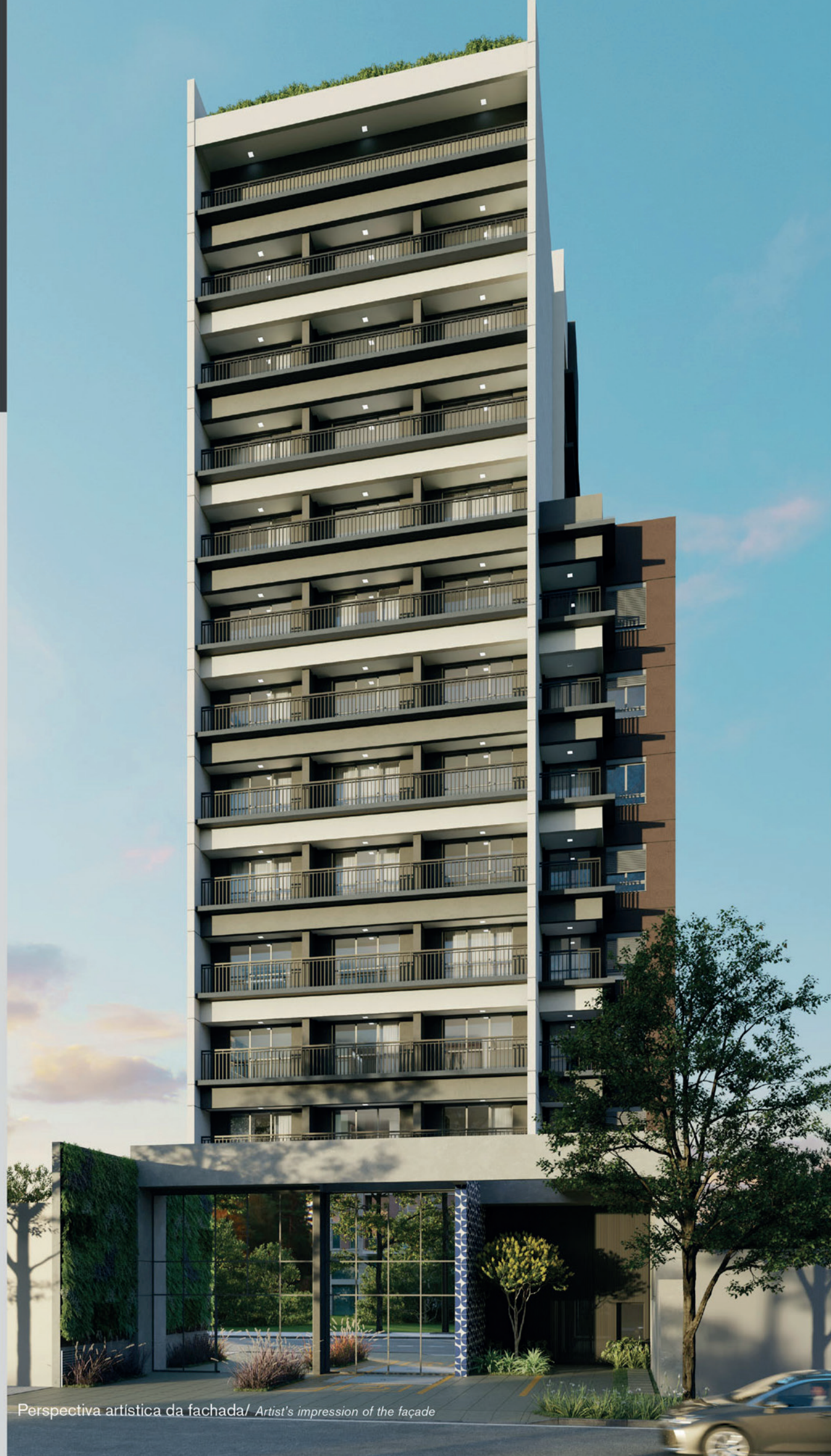
Perspectiva artística da fachada / Artist's impression of the façade

“Thinking of you, we thought differently.”