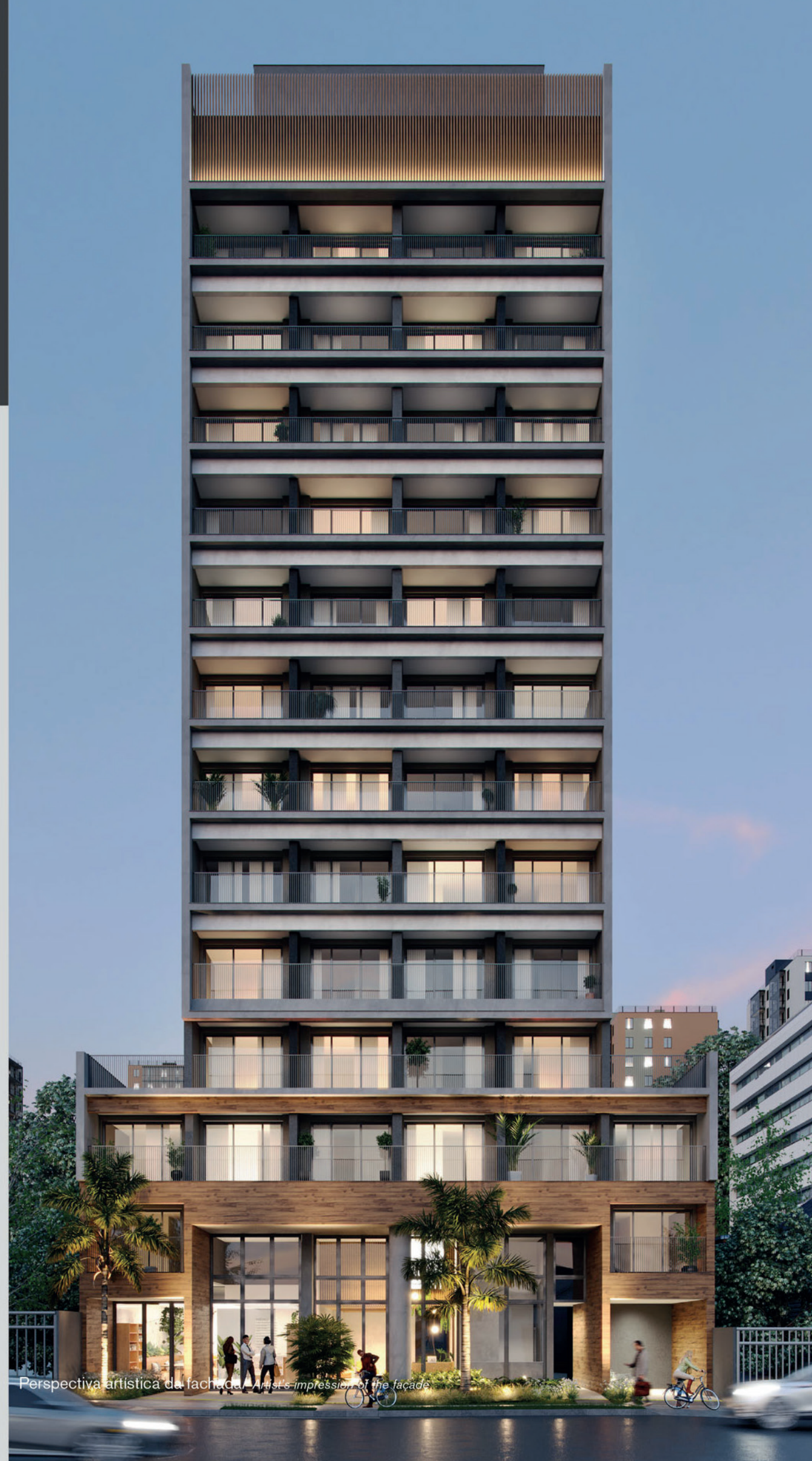
Perspectiva artística da fachada / Artist's impression of the façade

“Close to everything that's important to you.”