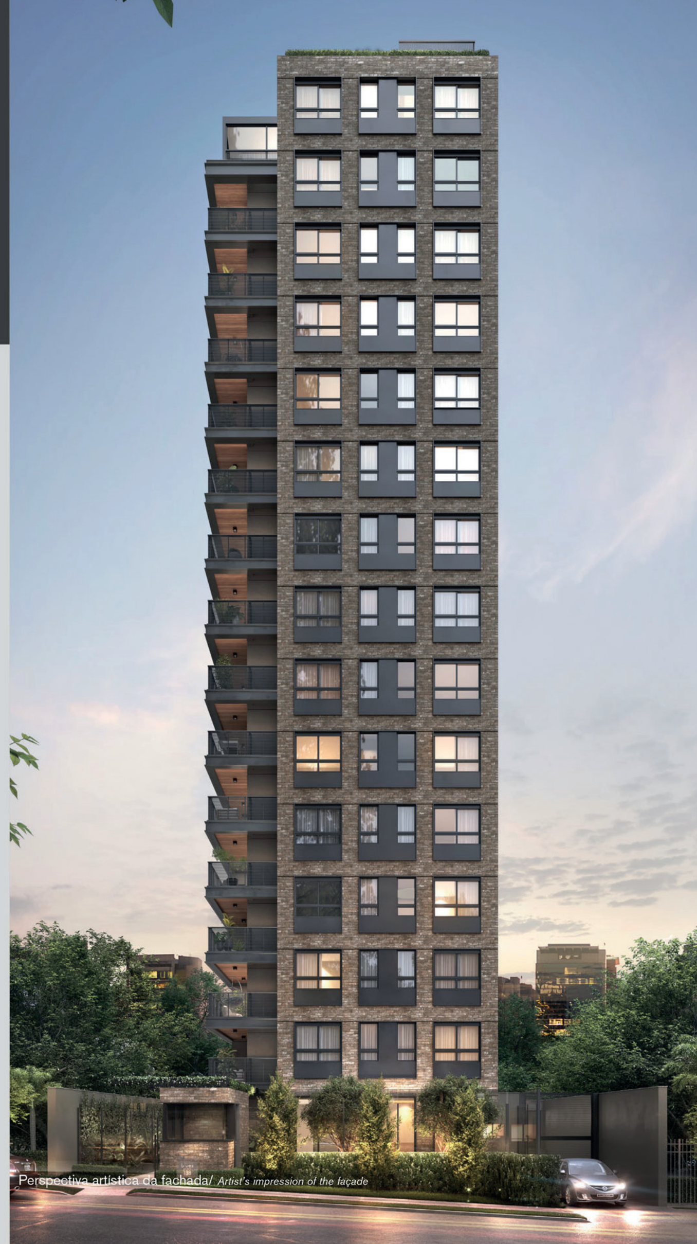
Perspectiva artística da fachada / Artist's impression of the façade