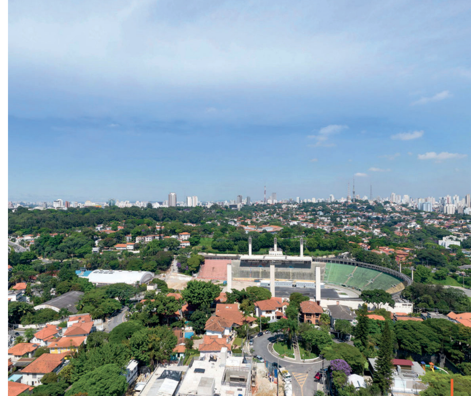
Vista do 16º andar / View from the 16th floor

“Synonymous with exclusivity in every detail per sqm.”