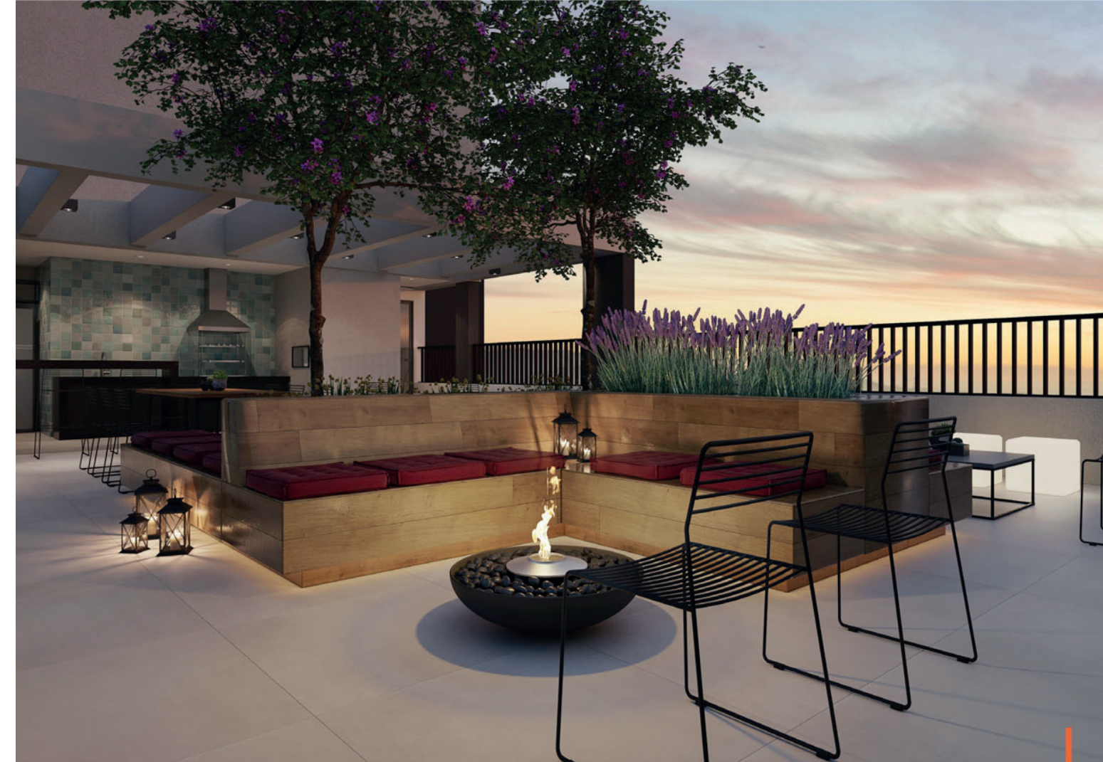
Perspectiva artística do lounge externo / Artist's impression of outdoor lounge area