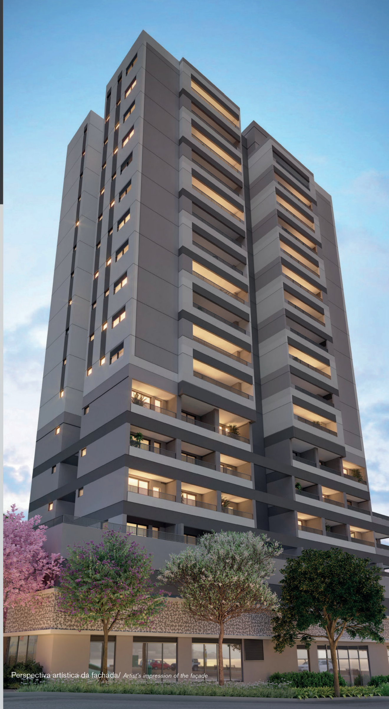
Perspectiva artística da fachada / Artist's impression of the façade