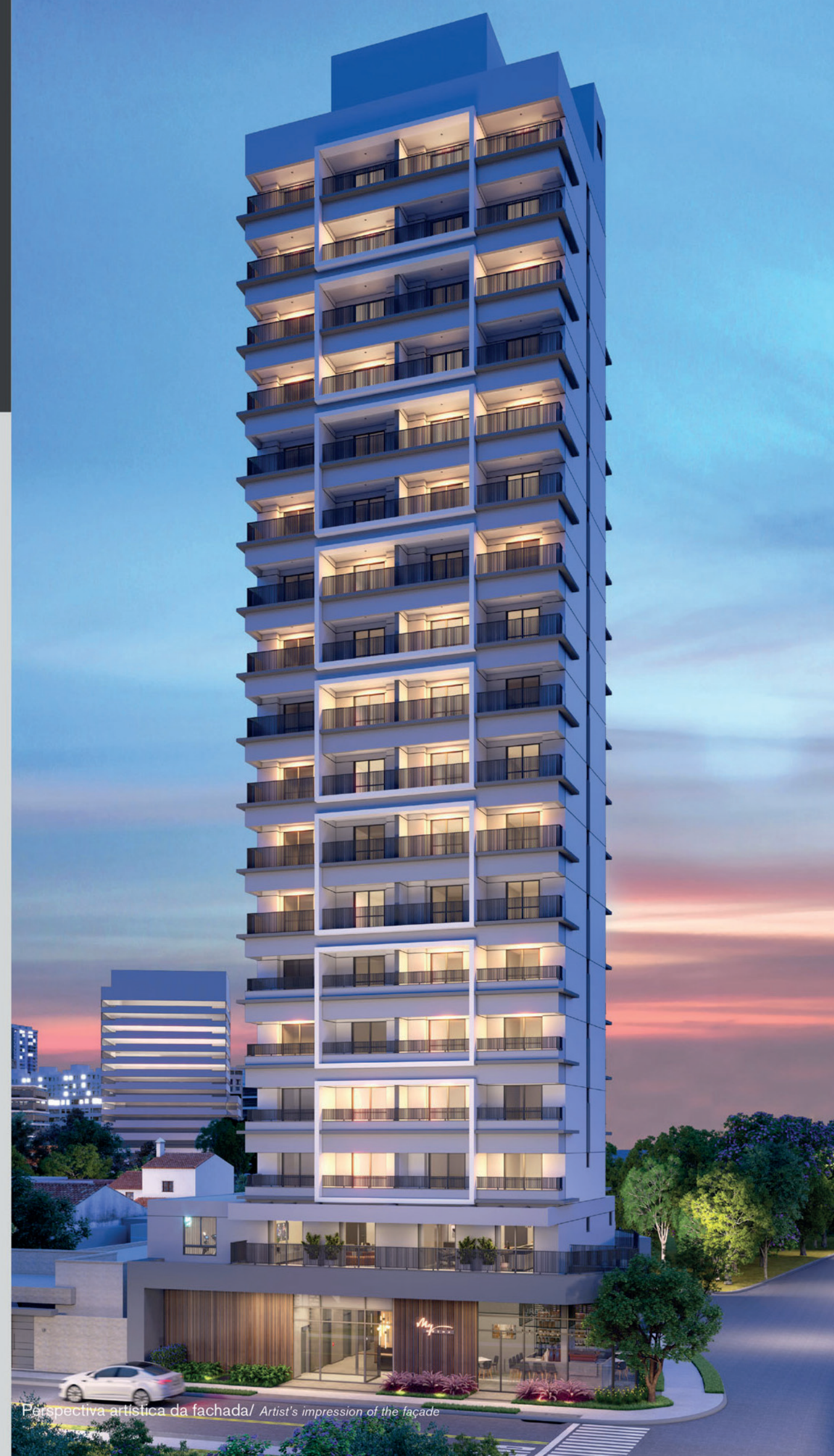
Perspectiva artística da fachada / Artist's impression of the façade

“A unique opportunity in a neighborhood that needs no introduction.”