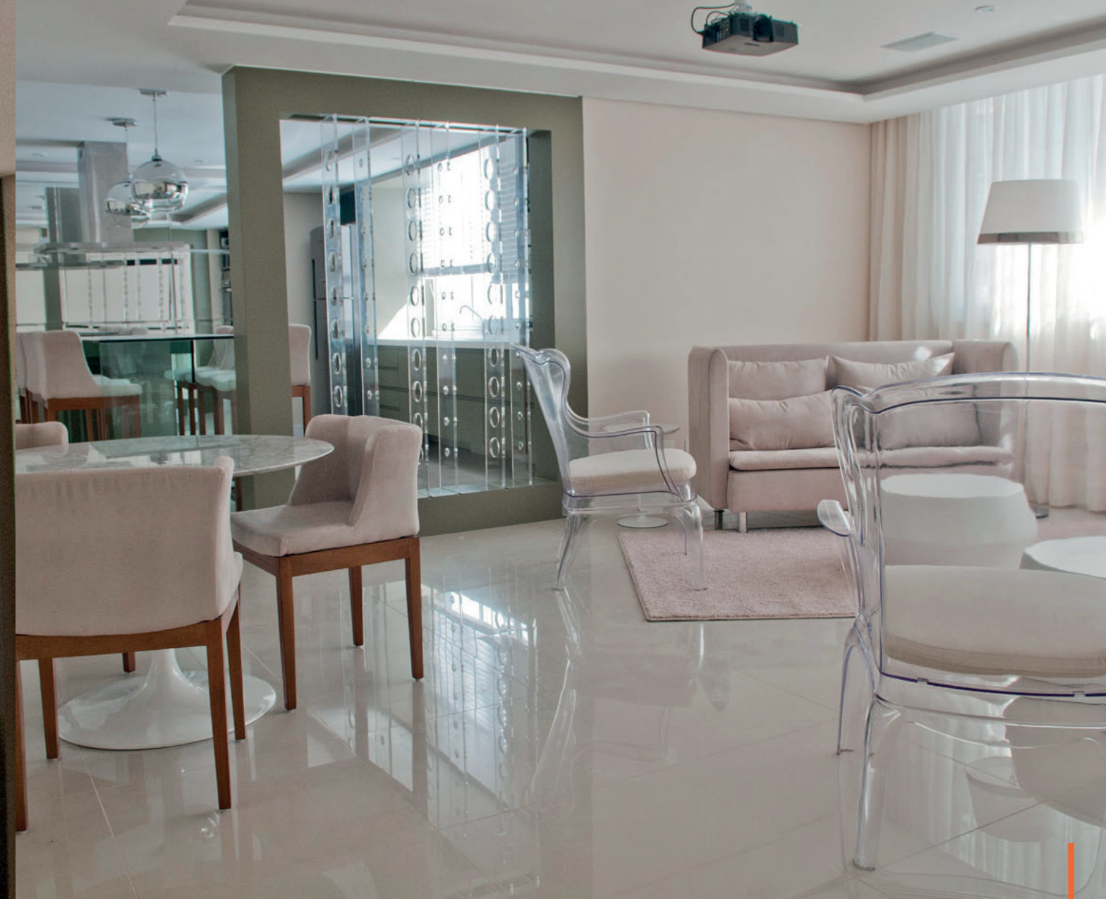
Salão de festas / Party hall