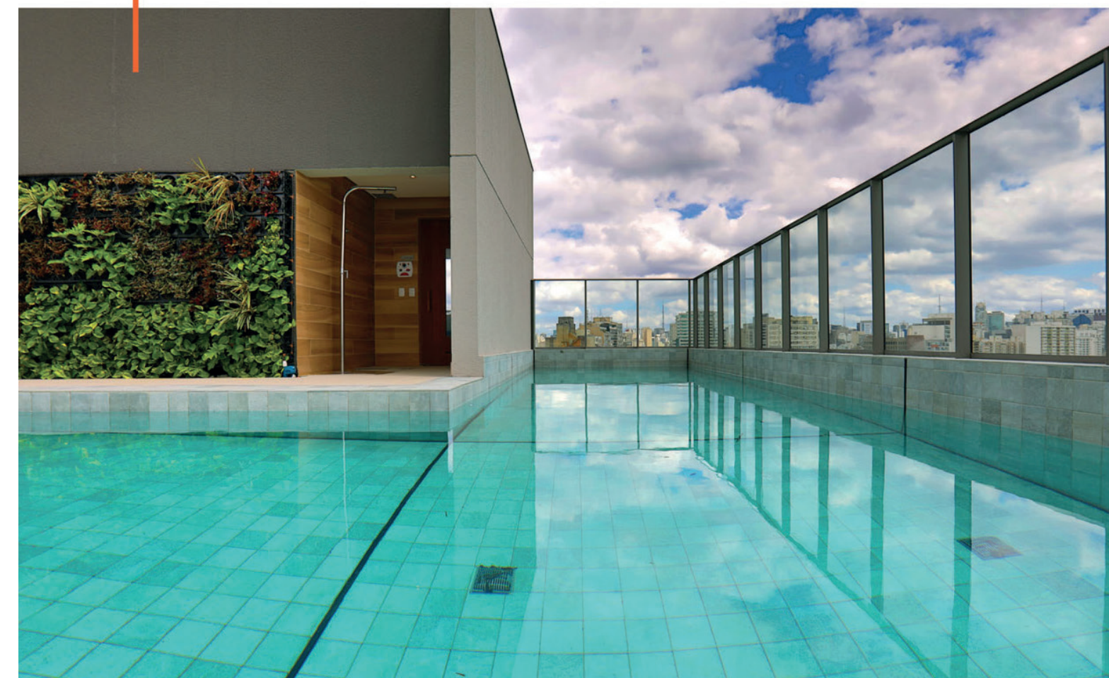
Piscina / Swimming pool

In an area where the price per square foot has been increasing for more than ten years, THINK HOME REPÚBLICA is totally connected to the essence of the district. In the middle of mobility, gastronomy, and culture, its facade blends in with the street art and is part of the AQUÁRIO URBANO® project.