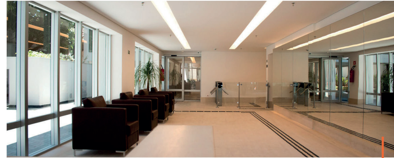
Lobby / Lobby

“Av. Marquês de São Vicente as a new hub for real estate and business expansion.”