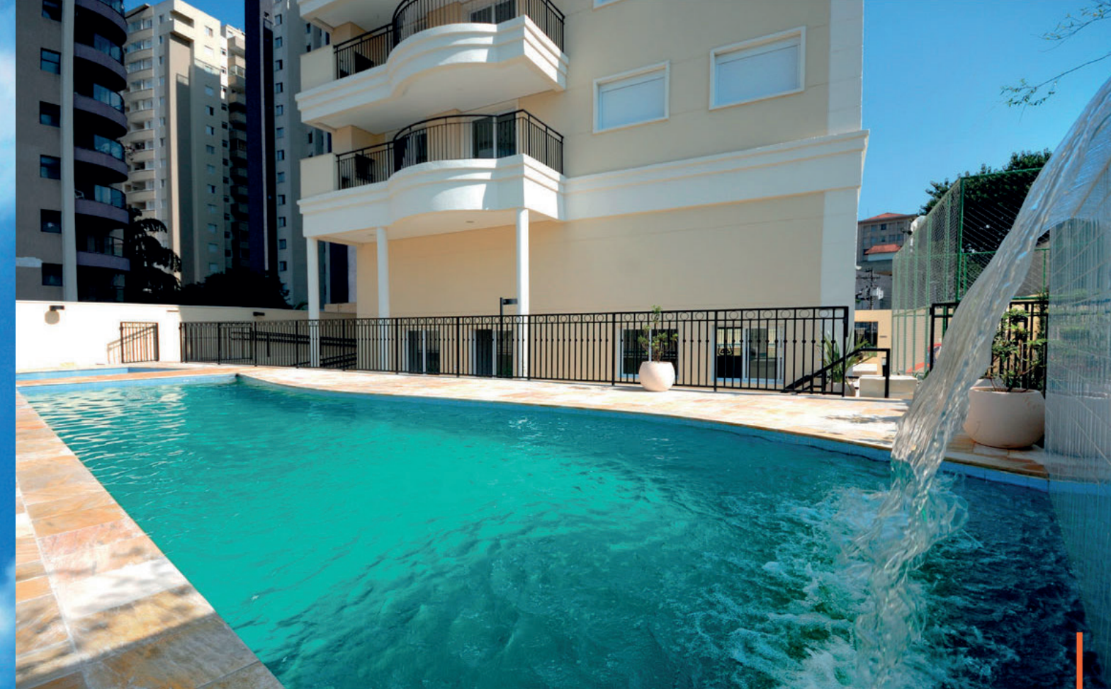
Piscina / Swimming pool