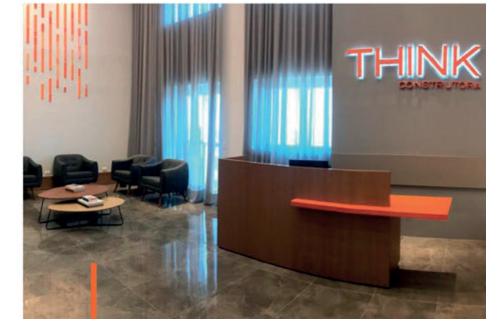
Recepção escritório THINK THINK office reception

Próxima do metrô da Barra Funda e de corredores de ônibus, a região também oferece infraestrutura de lazer, como o Parque da Água Branca, o Memorial da América Latina e os shoppings West Plaza e Bourbon, comércios e serviços, fóruns, supermercados e bancos. Um empreendimento que transforma a experiência corporativa e combina com empresas em evolução. A torre única de 29 pavimentos também se tornou nosso endereço empresarial.