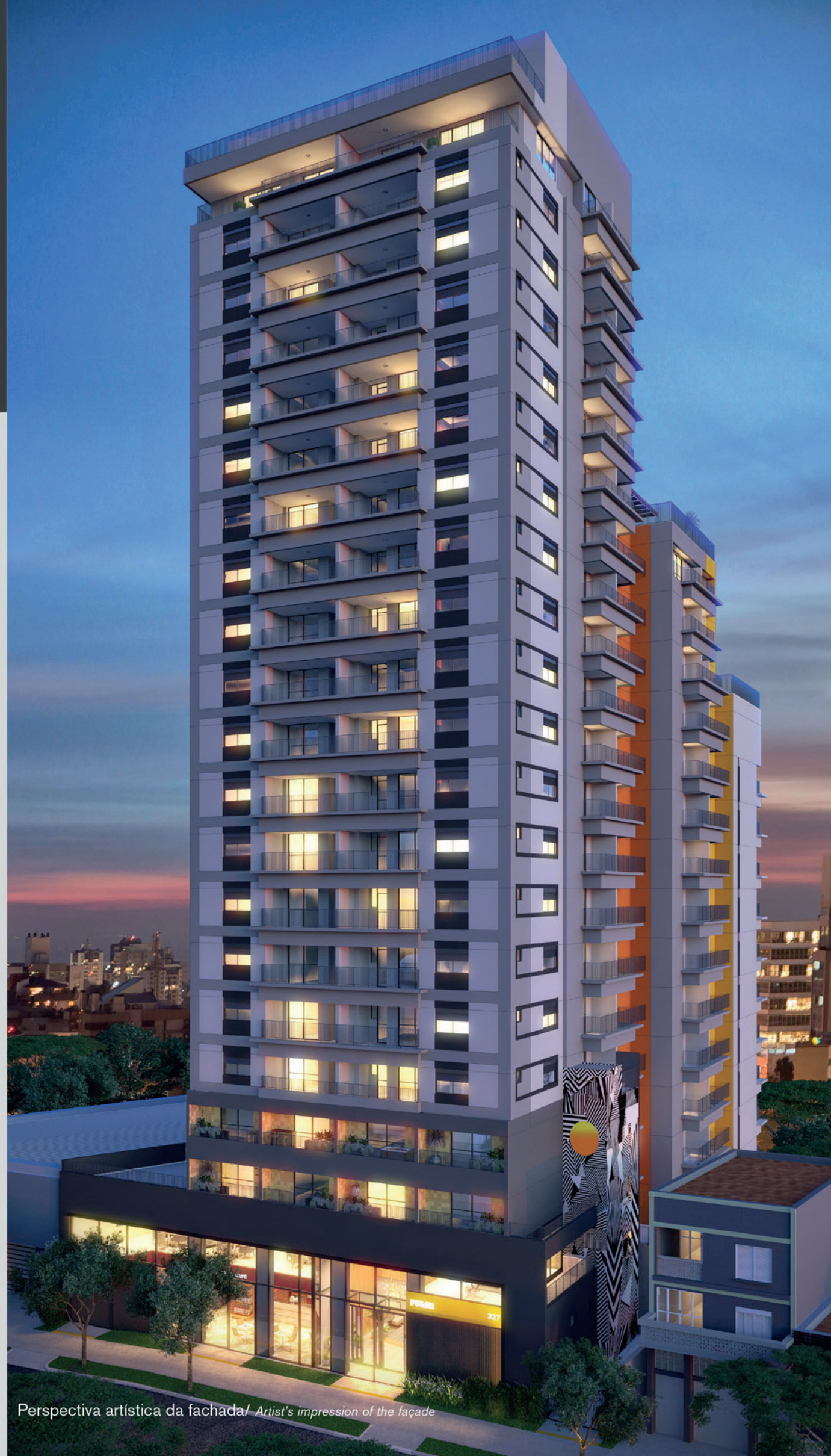
Perspectiva artística da fachada / Artist's impression of the façade

“Inspired by connection, at the heart of everything.”