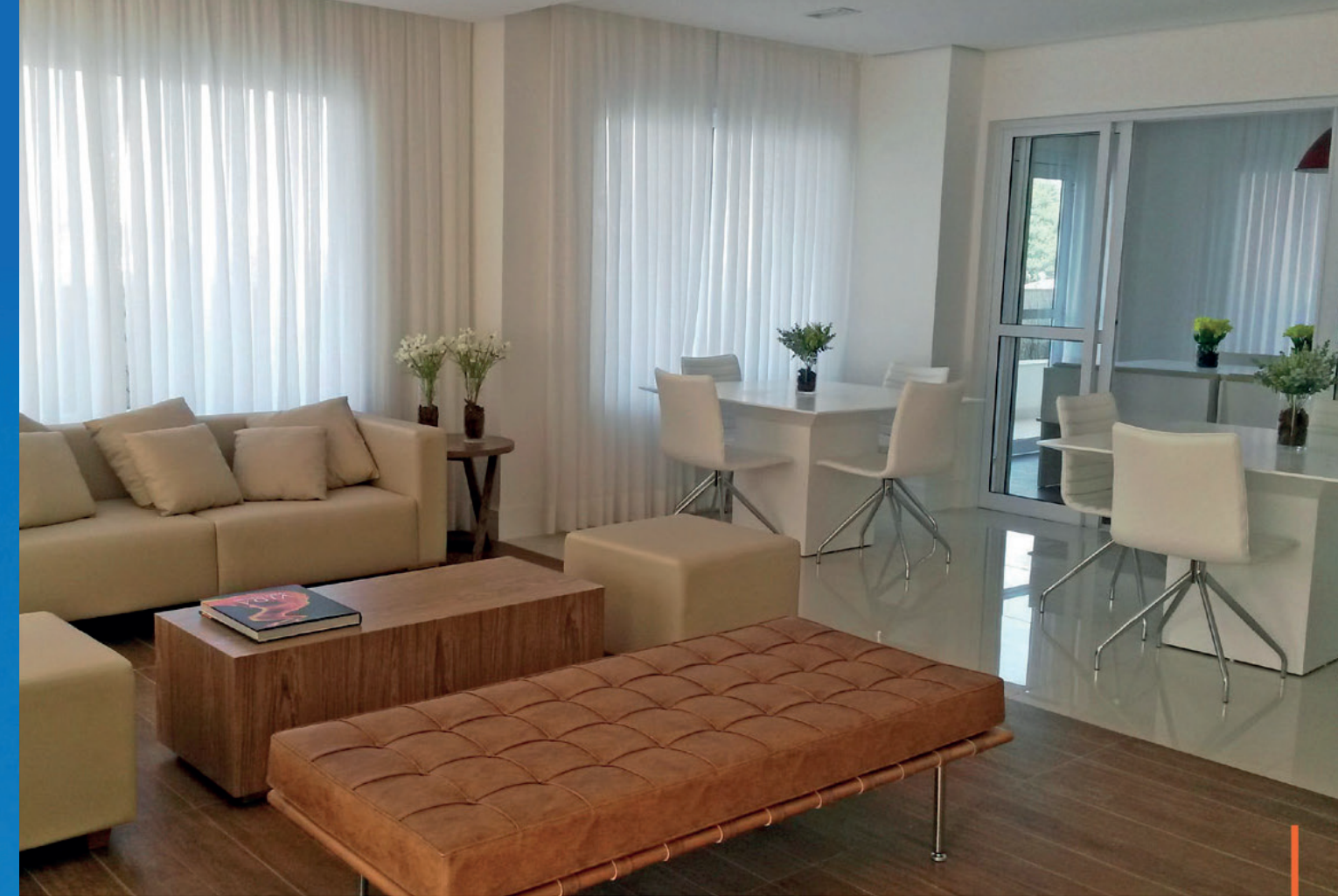
Salão de festas / Party hall

“Para a THINK, pensar em um projeto que envolve pessoas é pensar no bem-estar que ele pode oferecer.” “To THINK, considering a project that involves people means thinking about the well-being it can offer.”