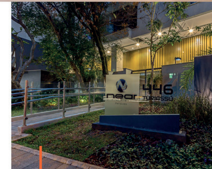
Acesso de pedestres Pedestrian access